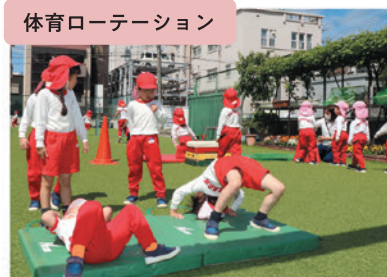
体育ローテーション

バス送迎の園児は中バス・ワンワンバス・ミニワンバスの3台で、お歩きの園児は家族の方と一緒に登園します。「おはようございます。いってきます。」元気な声が、幼稚園に響きます。